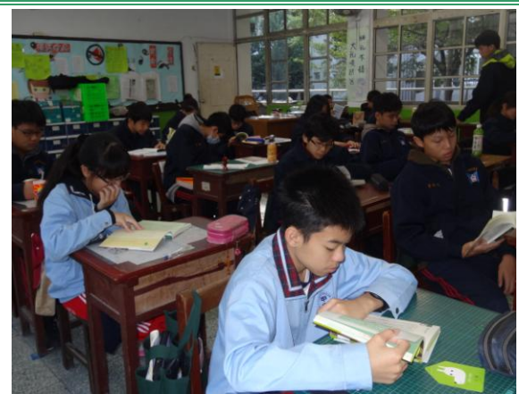
擴展生涯資源運用之深度