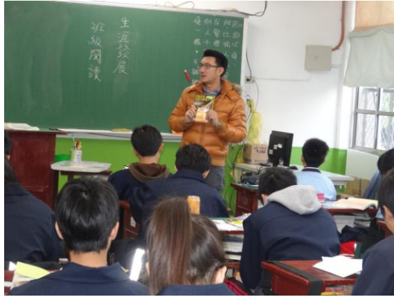
導師引導學生透過閱讀自我覺察