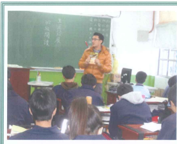
導師引導學生透過閱讀自我覺察