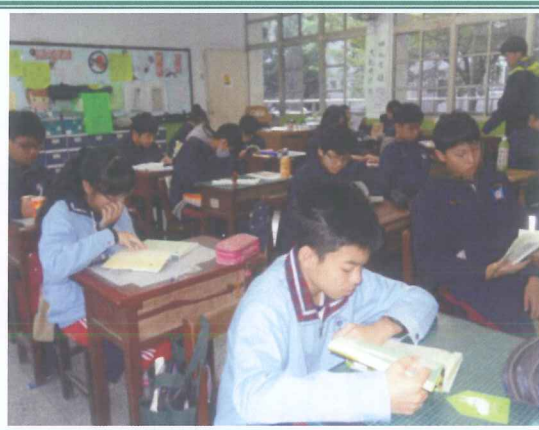
擴展生涯資源運用之深度