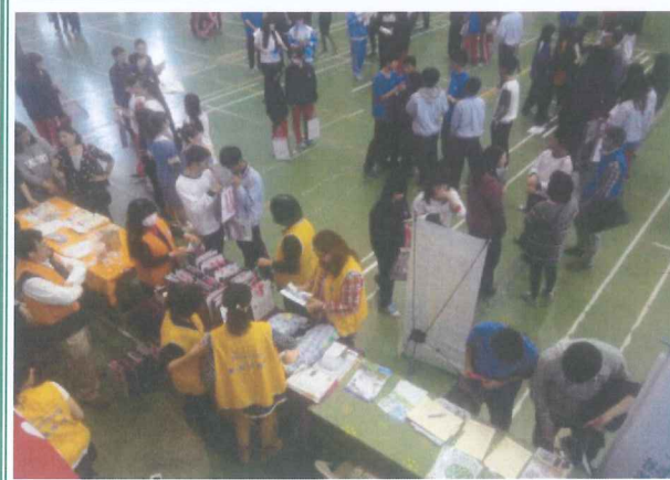
各校來賓向學生介紹學校特色