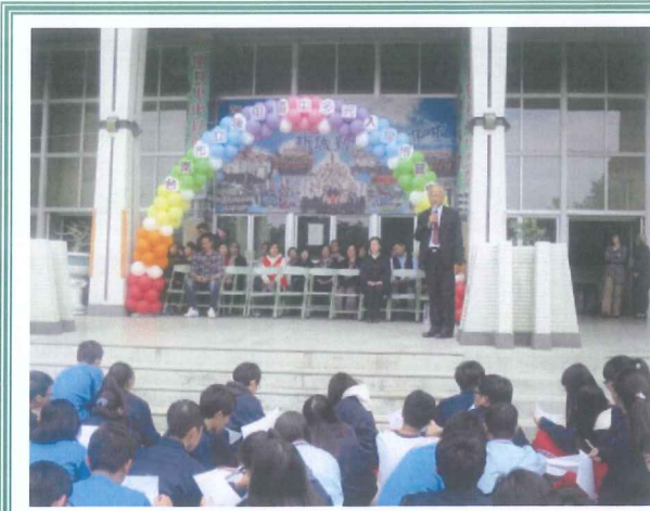
多元入博覽會開幕式