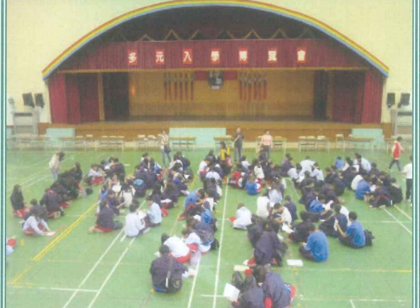
結束，學生協助撤場