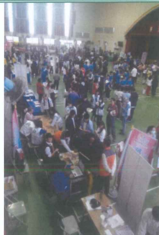
學生到各校攤位參觀