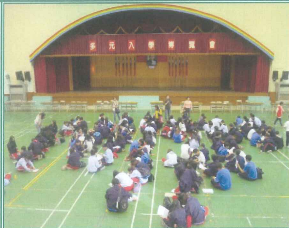
結束，學生協助撤場