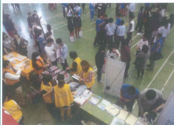
各校來賓向學生介紹學校特色