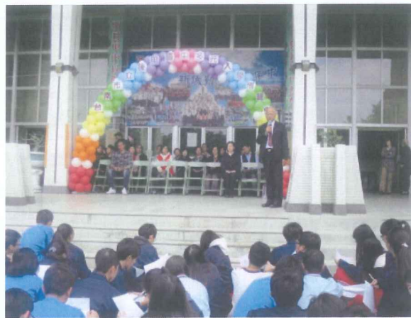
多元入博覽會開幕式