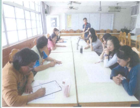
輔導主任業務說明