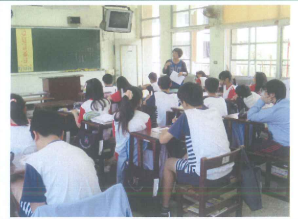
家長介紹妝品延伸產業