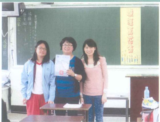
學生致感謝狀，與家長導師合影